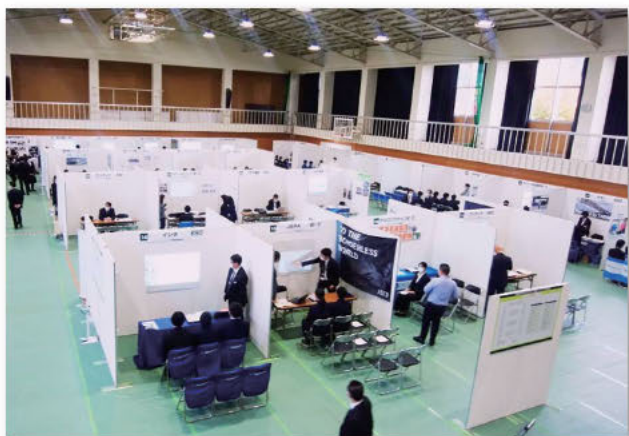
就職・進学合同説明会(会場:本校体育館)