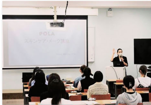
メイクマナー講座